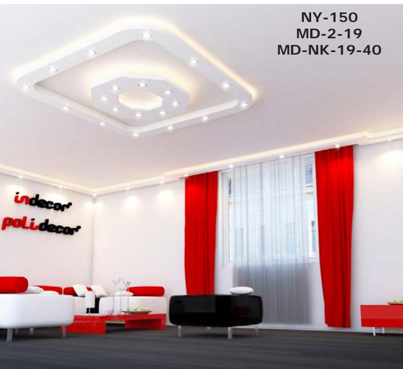
NY-150 MD-2-19 MD-NK-19-40